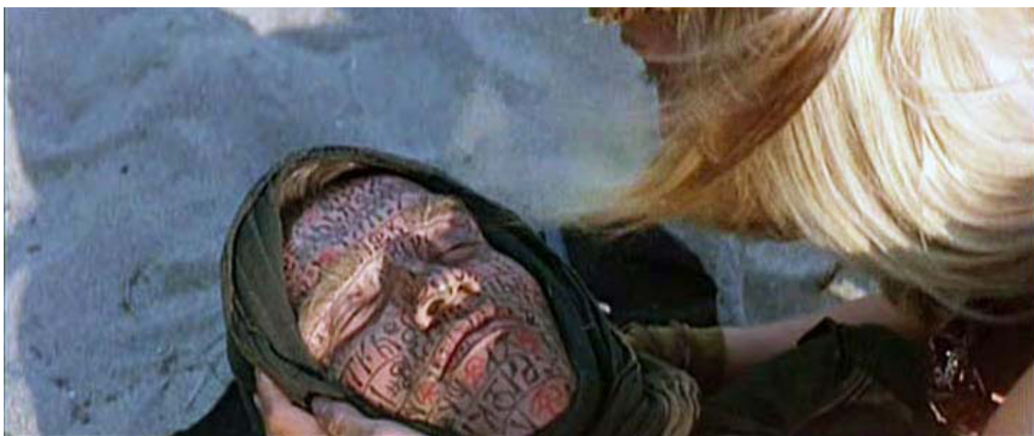
Figura 2. Fotograma en el que se aprecian varios Indalos en el rostro de Conan en la película de Miliuss

Un ejemplo que subraya lo anterior es una escena de la propia película, que me gustaría resaltar. En busca de venganza, Conan (Arnold Schwarzenegger) se encuentra con un mago llamado Akiro (Mako Iwamatsu), que dice poder convocar a los espíritus de los muertos y que ayudará a Conan en su búsqueda. En un momento posterior, en el que Conan es torturado y llevado al borde de la muerte, Akiro convocará a esos espíritus de los muertos (o como el los llama, dioses antiguos) para que traigan a Conan de vuelta al mundo de los vivos. En un complejo ritual, el mago pinta la cara de Conan con numerosas runas y símbolos.