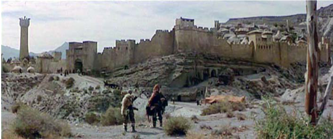
Figura 3. Fotograma de la escena en la que Conan se encuentra con la civilización (J. Miliuss, 1982).